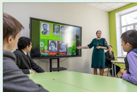
Один из обновленных кабинетов СОШ № 8, в котором ребята изучают татарский язык