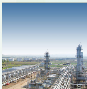
На Карабашской УКПН модернизированы печи нагрева