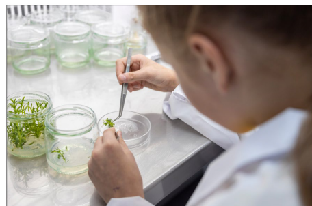
Воспитанники ЛДД уже клонировали более 100000 ростков