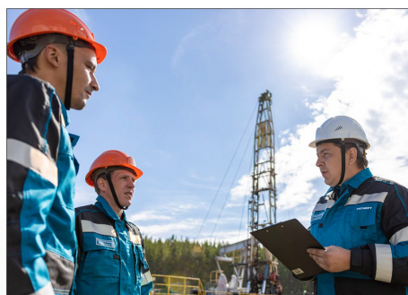
Визитная карточка ЛЦПРС – использование технологии колтубинга, установки с гибкой непрерывной насосно-компрессорной трубой