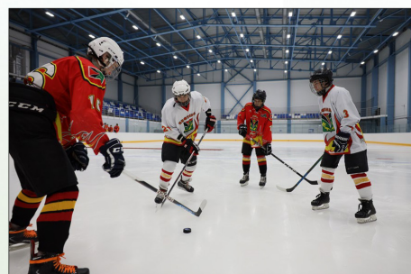
Новый ледовый комплекс стал спортивным домом для воспитанников хоккейной школы «Нефтяник»