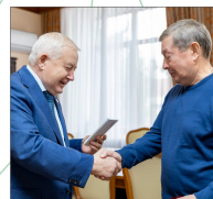
Юбилей – хороший повод для дружеской встречи с коллегами