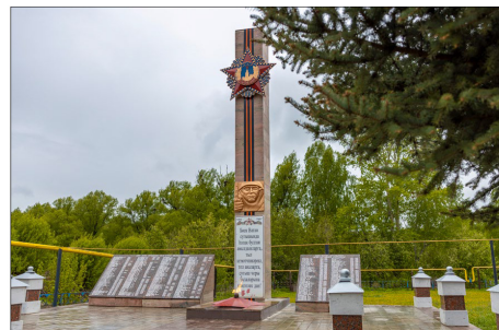
В рамках реконструкции памятника в селе Верхние Чершилы на средства Компании обновили ограждение, ступени, ведущие к стеле, плиты с именами героев