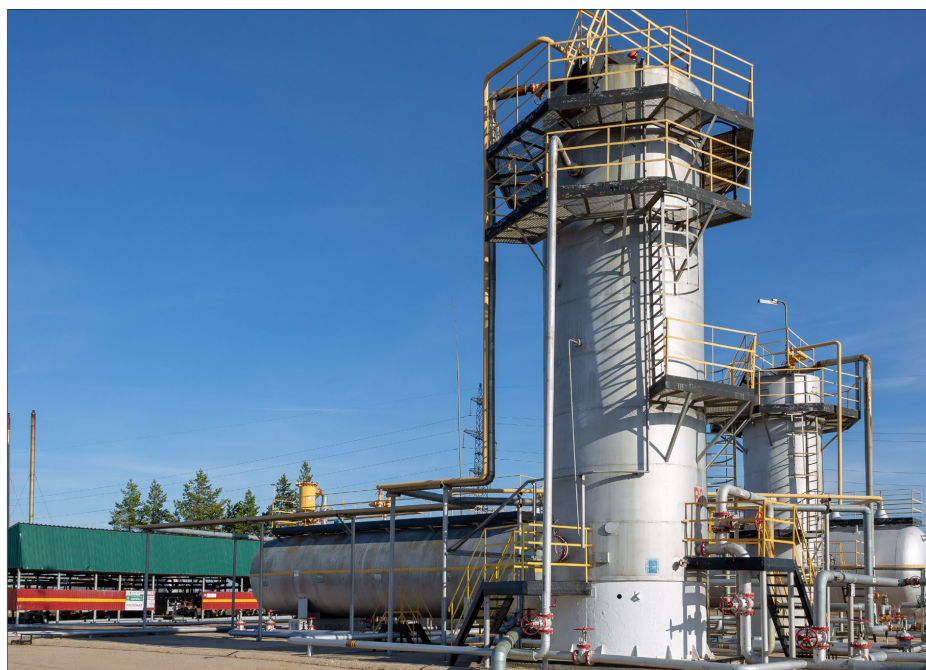
За счет расширения системы газосбора и модернизации существующих факельных систем попутный нефтяной газ будет направляться на установку Миннибаевского газоперерабатывающего завода

Работники НГДУ «Лениногорскнефть» получили дипломы с отличием по программе «Управление производственным персоналом». Разработанная Корпоративным университетом целевая образовательная программа «Татнефть Мастер – 2030» стала первым в Компании