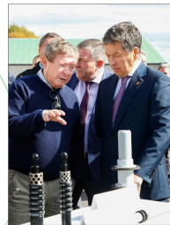
На выставке достижений и передовых разработок НГДУ «Лениногорскнефть» в 2015 году

В 1989 году герою публикации поступило предложение перейти выборы на должность на-