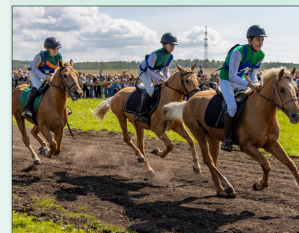
Скачки лошадей татарской породы 2-х лет

Фестиваль стал не только площадкой для спортивных достижений, но и важным событием для обмена опытом среди коневодов и любителей лошадей.